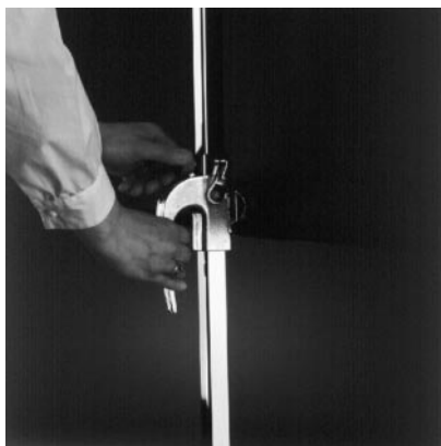
Einfach zu bedienende, variable Höhenverstellung.