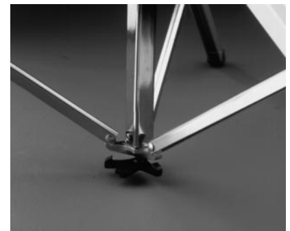
Patentierte Dreibeinarretierung, die das Aufstellen der Bildwand wesentlich erleichtert. Auslösen der Arretierung durch die Fußspitze.