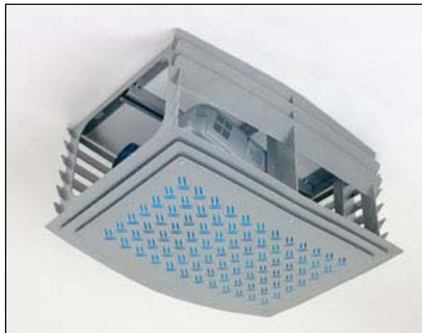
Grabber boxer - super design, super sicher.

Name: Grabber boxer Farbe: silber Prüfung: GS TÜV geprüft Länge: fest Befestigung: Anschlußschiene Anschluß: disc-Platte Belastung: 20 kg